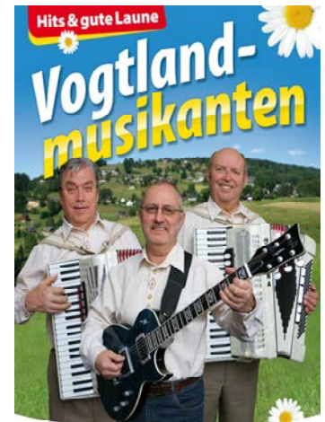
Vogtlandmusikanten! 14. Februar ab 14 Uhr im Walfischsaal zum Unterhaltungsnachmittag.

Wer seine Liebsten mal mit einem Sonntag voller Genuss und musikalischer Unterhaltung ins Staunen bringen möchte, sollte sich gleich den 14. Februar vormerken. Denn da ist Valentinstag und die beste Gelegenheit für so eine Überraschung. Nach einem Glas Sekt zur Begrüßung erwartet Sie ein 2-Gänge-Schlemmermenü. Eine Kraftbrühe „Celestine“ als Vorsuppe bekommen Sie und Ihre Gäste und danach Wildlachsfilet auf Gemüsebett mit Bandnudeln. Wer den Nachmittag gleich noch musikalisch ergänzen möchte, kann sich gerne im Saal zum Valentinstagsprogramm der „Vogtlandmusikanten“ einfinden, um den besonderen Sonntag bestens ausklingen zu lassen. Natürlich steht auch einem Kaffeetrinken während der Programmpause nichts im Wege.