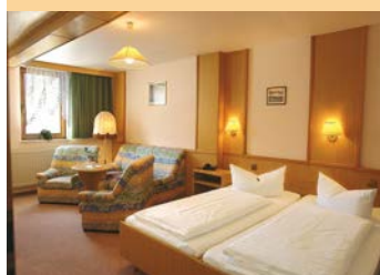
8 Doppelzimmer, 2 Dreibettzimmer und 1 Einzelzimmer beherbergt der „Gasthof zum Walfisch“

Unser Haus verfügt auch über 11 Gästezimmer. Ideal für Ihre Familien- oder Firmenfeier. Alles unter einem Dach. Essen, feiern, kegeln, minigolfen, tanzen und dann mit ein paar Schritten ins Bett. Ist das nicht genial? Wir denken schon! Sprechen Sie uns an und wir bereiten Ihnen gerne für Ihre nächste Feierlichkeit ein passendes Angebot mit Übernachtung in unserem Haus.