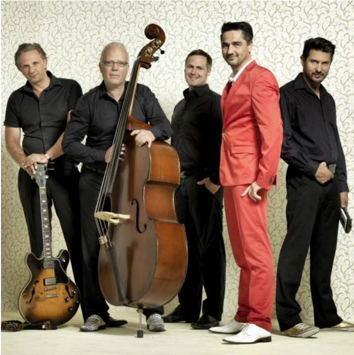
B.B. & The Blues Shacks - Sie lieben Musik und schaffen es, ihre Zuhörer im besten Sinne zu unterhalten. Mit einer Mischung aus Soul und Rhythm & Blues. Seit 25 Jahren sind sie nun weltweit unterwegs. Das Ergebnis: bald 4000 Konzerte und zahlreiche Preise vom „German Blues Award“ bis zur Auszeichnung als „Europas beste Bluesband“.