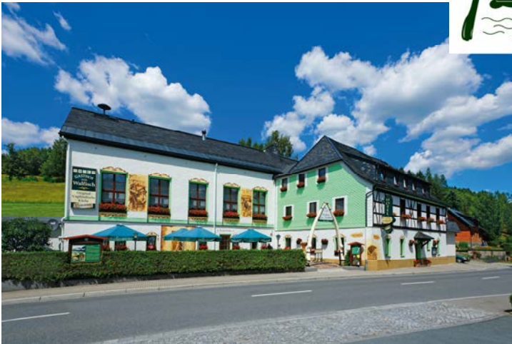
Blick vom Parkplatz auf die neu gestaltete „Walfischfassade“.

bogen vor der damaligen Hammer-schänke aufgestellt wurden und dem Gasthof seinen heutigen Namen gaben. Viele Besucher und Gäste unseres Hauses brachten uns bis jetzt ihre Begeisterung über die Neugestaltung zum Ausdruck. Auch auf die Sanierung des Daches sind wir stolz. Über 600 m 2 Dachfläche konnten seit dem letzten Sommer durch einheimische